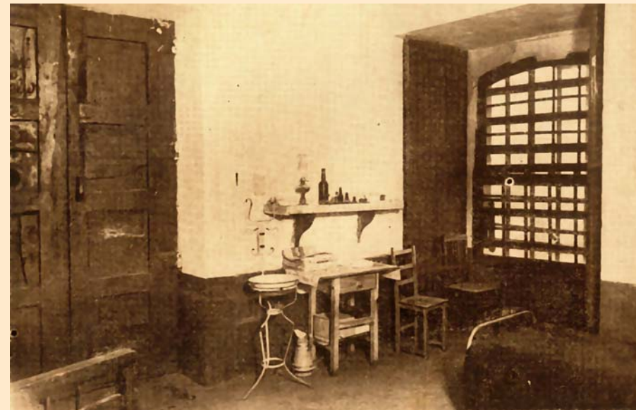
Cela da Cadeia da Relação onde esteve preso Camilo Castelo Branco